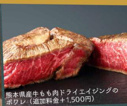
熊本県産牛もも肉ドライエイジングのポワレ (追加料金+1,500円)