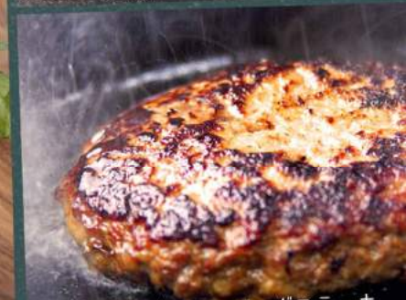
松阪牛100%のハンバーグステーキ