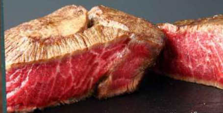
熊本県産牛もも肉ドライエイジングのポワレ (追加料金+1,500円)