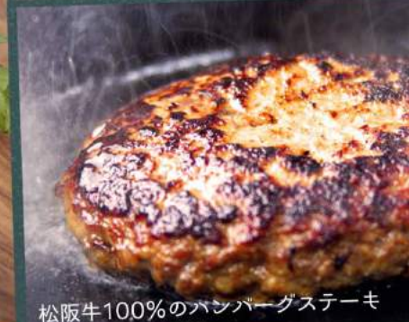
松阪牛100%のハンバーグステーキ