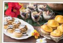
「エッグベネディクト」や「アサイーボウル」

朝ごはん美味しい異文化を体験♪ 夏の朝食は今年もグレードアップ! テーマは「世界の朝ごはん」 日本定番の朝食に加え世界10カ国の朝食を お楽しみになります。